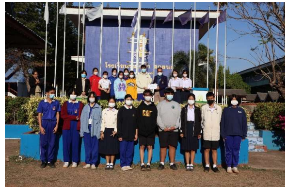
มอบเกียรติบัตรประกวดห้องเรียน