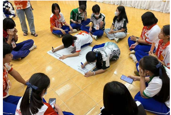
โครงการครูศาสตร์อาสาพัฒนาท้องถิ่น