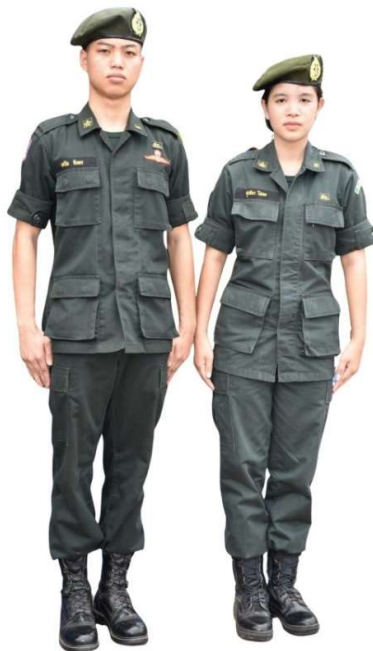
ตัวอย่างการแต่งกายชุดนักศึกษาวิชาทหาร ระดับชั้นมัธยมศึกษาตอนปลาย