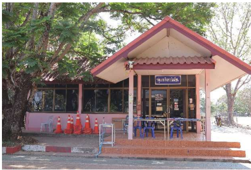
๒.๑๓ อาคารสำนักงานกลุ่มงานกิจการนักเรียน