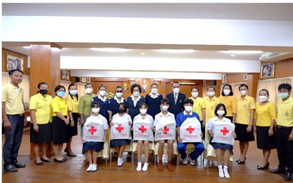
เหล่ากาชาดสกลนครตรวจเยี่ยมนักเรียน ทุนพระกนิษฐาธิราชเจ้า กรมสมเด็จพระเทพรัตนราชสุดาฯ