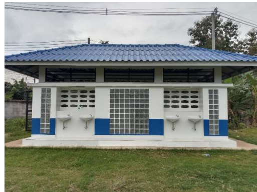
๒.๘ ห้องน้ำห้องส้วมแบบ ๖ ที่