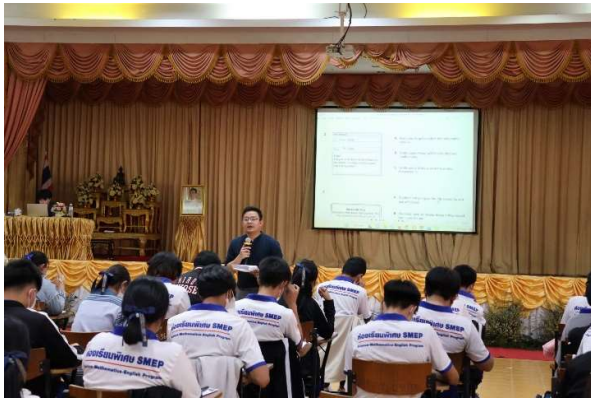
ติวสอบวัดความรู้ภาษาอังกฤษ CEFR