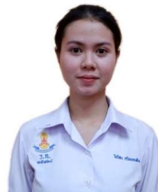
ตัวอย่างการปักเครื่องหมายโรงเรียน ระดับชั้นมัธยมศึกษาตอนปลาย