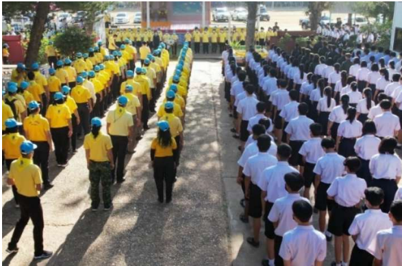
พิธีรำลึกวันทรงปลูกต้นไม้