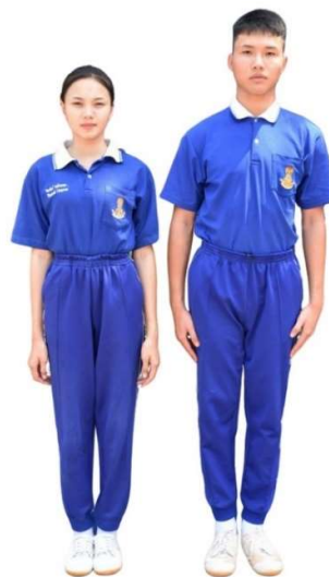
ตัวอย่างการแต่งกายชุดพลศึกษา ระดับชั้นมัธยมศึกษาตอนปลาย