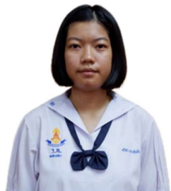
ตัวอย่างการปักเครื่องหมายโรงเรียน ระดับชั้นมัธยมศึกษาตอนต้น

๓.๒ นักเรียนระดับชั้นมัธยมศึกษาตอนปลาย ต้องปักเครื่องหมายรูปมหาพิชัยมงกุฎ ติดที่อกเสื้อด้านขวามือเหนือแนวราวนม มีอักษรย่อ “ร.ก.” ที่อกเสื้อด้านขวาเหนือราวนม ได้มหาพิชัยมงกุฎ ติดบนเสื้อด้วยด้ายหรือไหมสีน้ำเงินแก่ แบบตัวพิมพ์ธรรมดา ขนาดตัวอักษรสูง ๑.๕ เซนติเมตร ได้อักษรย่อ โรงเรียนเป็นเลขประจำตัวบนเสื้อ หน้าอกด้านขวาเป็นตัวเลขไทยขนาดสูง ๑.๒ เซนติเมตร มีชื่อและนามสกุล ของนักเรียนปักด้วยด้ายหรือไหมสีน้ำเงินแก่แบบตัวพิมพ์ธรรมดาขนาดตัวอักษรสูง ๑.๒ เซนติเมตรติดบนเสื้อ หน้าอกด้านซ้าย มีจุด ที่ปกคอเสื้อด้านขวามือ จำนวนตามระดับ