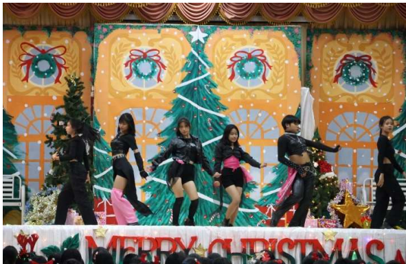
งานวันคริสต์มาส