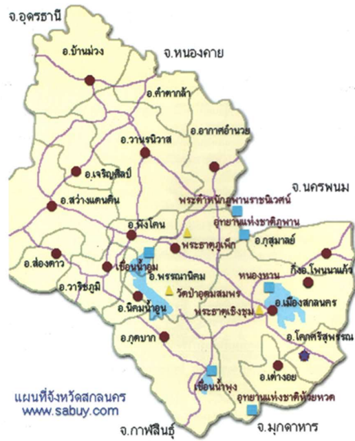
แผนที่ตั้งโรงเรียนร่วมเกล้า อำเภอโคกศรีสุพรรณ จังหวัดสกลนคร

★ ที่ตั้งโรงเรียนร่วมเกล้า อ.โคกศรีสุพรรณ จ.สกลนคร