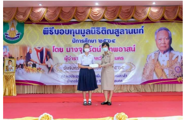
มอบทุนมูลนิธิดิถนสุลนันท