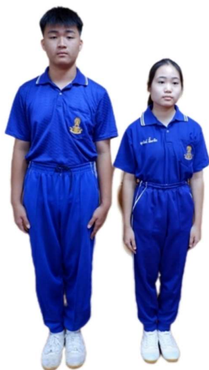
ตัวอย่างการแต่งกายชุดพลศึกษา ระดับชั้นมัธยมศึกษาตอนต้น

๔.๓ ในวันที่ไม่มีชั่วโมงเรียนวิชาพลศึกษา ห้ามนักเรียนสวมชุดพลศึกษามาโรงเรียน และห้ามนักเรียนสวมชุดพลศึกษา ร่วมกับกางเกงนักเรียนหรือกระโปรงนักเรียน หรือเสื้อนักเรียนร่วมกับ กางเกงพลศึกษาในเวลาเดียวกัน มาเรียน ในชั่วโมงเรียนวิชาพลศึกษา หรือวันปกติโดยเด็ดขาด เว้นแต่ได้รับ อนุญาต