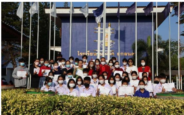
มอบเกียรติบัตรครูและนักเรียนที่แข่งขัน งานศิลปหัตถกรรมนักเรียน ครั้งที่ ๖๗