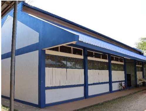
๒.๓ โรงฝึกงานคหกรรม