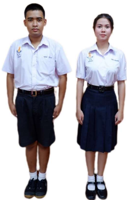
ตัวอย่างการแต่งกายชุดนักเรียน ระดับชั้นมัธยมศึกษาตอนปลาย

๒.๓.๕ รองเท้า ใช้รองเท้าหุ้มส้นสีดำ ชนิดผูกเชือก ทำด้วยหนังหรือวัสดุเทียมหนังสีดำ มีรูสำหรับร้อยเชือกไม่น้อยกว่าสองคู่และไม่เกินหกคู่สันใหญ่และสูงพอสมควร