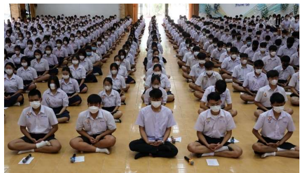
พิธีเจริญจิตภาวนาถวายพระพรชัยมงคล แด่สมเด็จพระเจ้าลูกเธอ เจ้าฟ้าพัชรกิติยาภาฯ