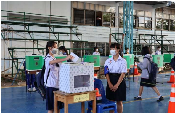
เลือกตั้งคณะกรรมการสภานักเรียน