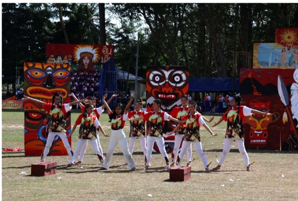
งานกีฬาภายใน “นนทรีทองเกมส์”