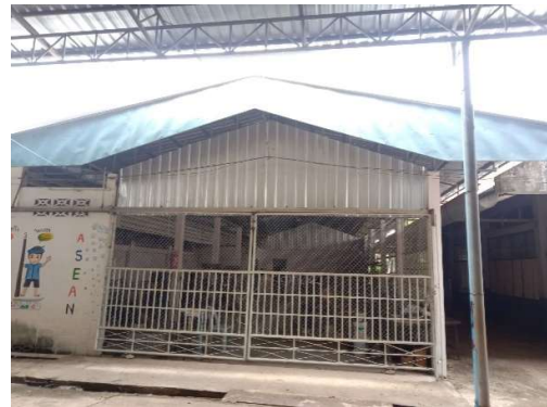
๒.๔ โรงฝึกงานอุตสาหกรรม