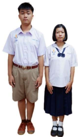
ตัวอย่างการแต่งกายชุดนักเรียน ระดับชั้นมัธยมศึกษาตอนต้น

เสื้อ เสื้อยุวกาชาดสีฟ้าอมเทา แขนสั้น ติดป้ายโรงเรียนที่ต้นแขนขวาต่ำ จากตะเข็บไหล่ ๑ เซนติเมตร ปักชื่อและนามสกุลด้วยไหมสีน้ำเงินบนผ้าขาว แล้วเย็บลงบนเสื้อเหนือกระเป๋าสีด้านขวา ผ้าผูกคอยุวกาชาดสีน้ำเงิน มีเครื่องหมายกาชาด กระโปรง กระโปรงยุวกาชาดสีฟ้าอมเทาจีบรอบ เข็มขัดยุวกาชาดสีดำ ถุงเท้าสีขาว รองเท้าสีดำ และหมวกยุวกาชาดสีน้ำเงิน ติดเข็มกาชาดที่หน้าหมวก