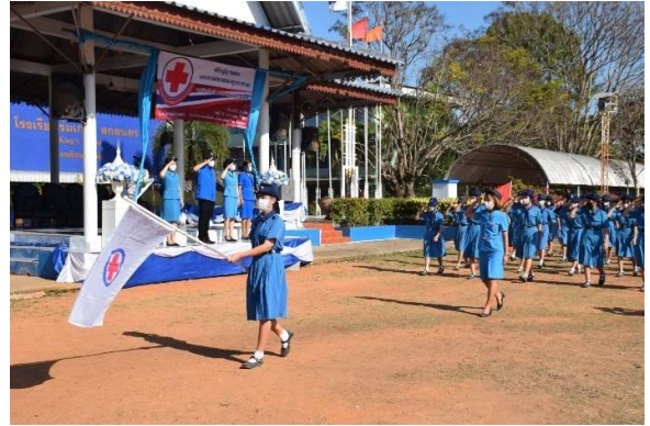
พิธีปฎิญาณตนและสวนสนามของยุวกาชาด