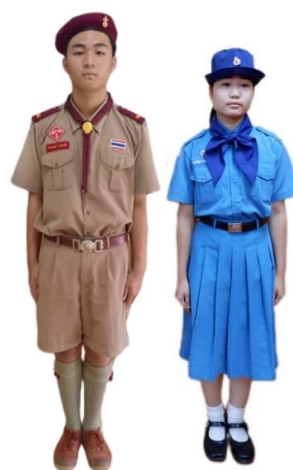
ตัวอย่างการแต่งกายชุดยุวกาชาด-ชุดลูกเสือ ระดับชั้นมัธยมศึกษาตอนต้น