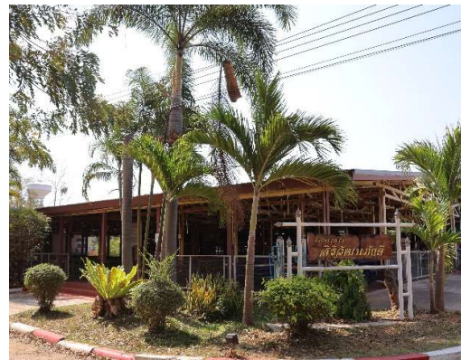
๒.๖ โรงอาหาร