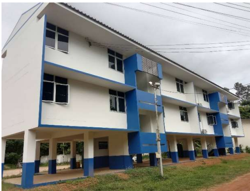
๒.๕ บ้านพักครู