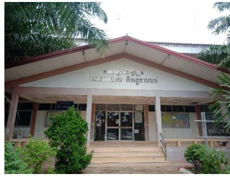
๒.๑๒ อาคารมูลนิธิรัฐบุรุษ พลเอกเปรม ติณสูลานนท์